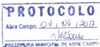
Márcio Moreira Vítor Prefeito Municipal